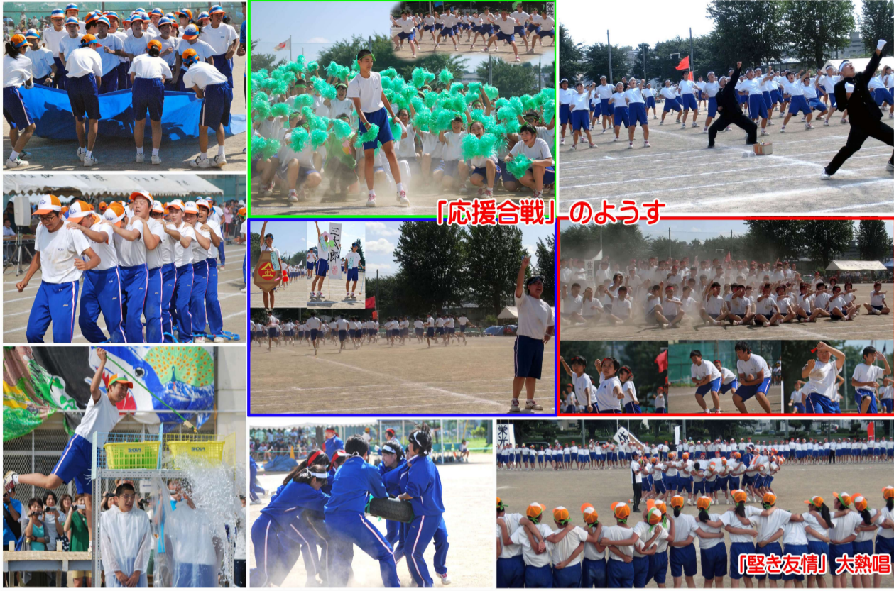
「応援合戦」のようす